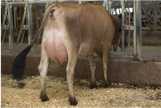
GOFF PHAROAH CIRCUS ACT THIRD DAM

VIERRA PRETENDERS RIVER VALLEY LISTOWL CSACT 44359-P VG-82%-3YR-USA HILLVIEW LISTOWEL-P RIVER VALLEY MILTON CRCSACT 4494 VG-87%-3YR-USA IGL MAGNUM MILTON GOFF PHAROAH CIRCUS ACT EX-90%-3YR-USA