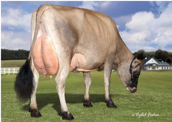
GOFF PHAROAH CIRCUS ACT THIRD DAM